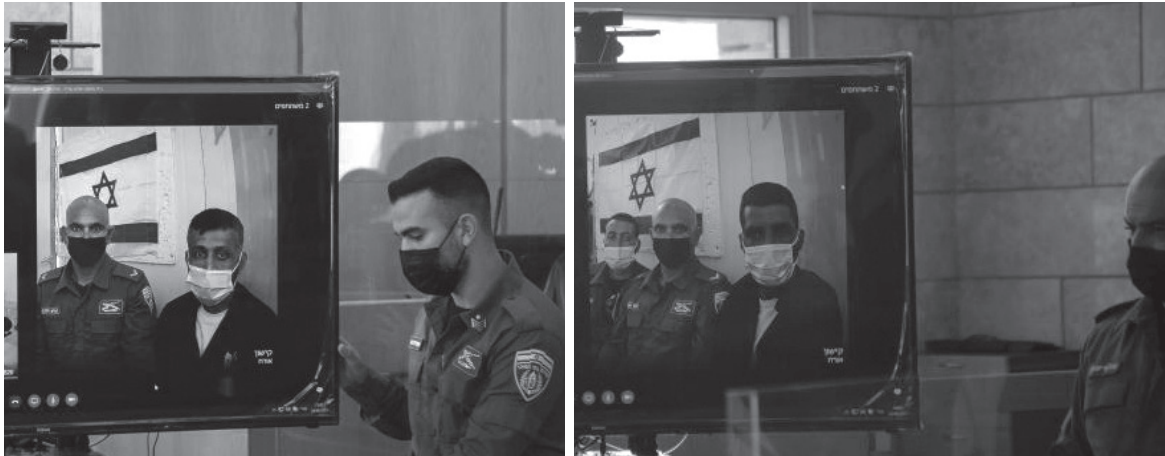
Nazareth, 19 September 2021. Court hearing of four recaptured Palestinians captives via video conference.

limitaciones que estas conllevan, donde cualquier persona presente en la audiencia (el juez militar, el fiscal militar, el “traductor”, etc.) puede escuchar cualquier tipo de comunicación o comentario que tenga lugar en su transcurso.