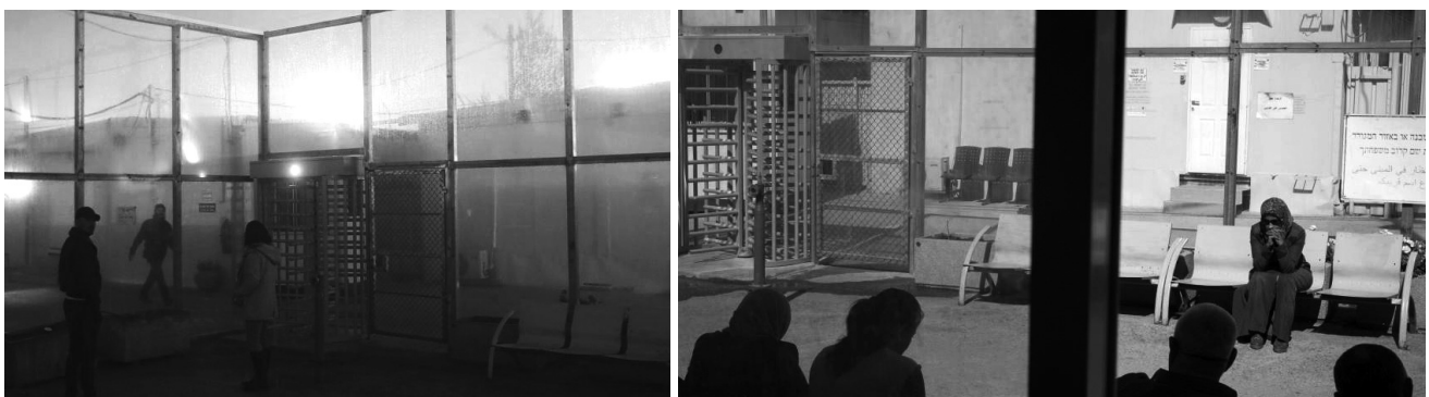
Tribunal militar de Ofer, TPO - 29 de octubre de 2017. Palestinos esperando fuera del aula de Ofer militar, TPO para comenzar las audiencias en el juicio de familiares y amigos que fueron arrestados por el ejército israelí, cerca de la ciudad de Ramallah, Cisjordania.

Los tribunales militares israelíes, arbitrarios y de naturaleza kafkiana, condenan a la población palestina en cuestión de minutos en juicios militares que tienen lugar en “cámaras” de remolques de alta seguridad, supervisados por colonos israelíes que ejercen de jueces y de fiscales militares. En estos tribunales la culpabilidad está predeterminada desde el principio. Por este motivo, los familiares de las personas detenidas asisten a las audiencias de los tribunales militares con la única esperanza de ver a sus seres queridos. Este sistema está construido sobre la base de la humillación y degradación, ya que pretende imponer un control total – legal, físico y psicológico – sobre la población palestina.