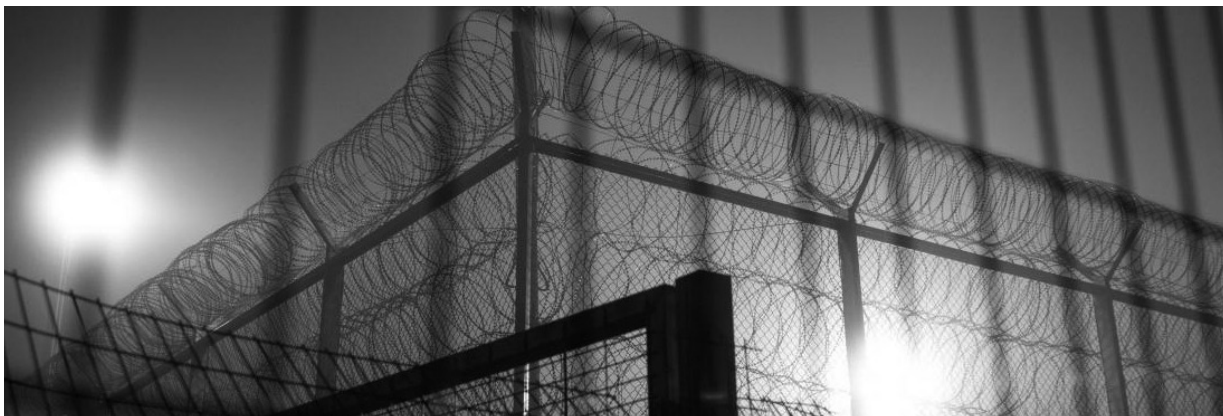
Tribunal militar de Ofer, TPO. Enero de 2018.

Los tribunales militares israelíes son el mecanismo central del sistema judicial militar de Israel, un elemento integral del régimen de ocupación y de apartheid israelí sobre los territorios palestinos ocupados. Los tribunales militares israelíes, parte de su sistema judicial militar, procesan a la población palestina de todas las edades y procedencias, fundamentándose en las órdenes militares emitidas por el comandante militar israelí del área de Cisjordania. El alcance y la amplitud de estas órdenes militares criminaliza los derechos fundamentales – tanto individuales como colectivos – del pueblo palestino, como lo son la libertad de expresión y de asociación. En el marco de este sistema judicial, militar y racista, cientos de miles de personas palestinas han sido juzgadas y condenadas en procedimientos judiciales grotescos, que tienen una tasa de condena superior al 99%. Simultáneamente, el mismo sistema somete a todas estas personas a duras condiciones de detención, a tortura, a encarcelamiento prolongado y a graves vulneraciones de sus derechos básicos y de su dignidad.