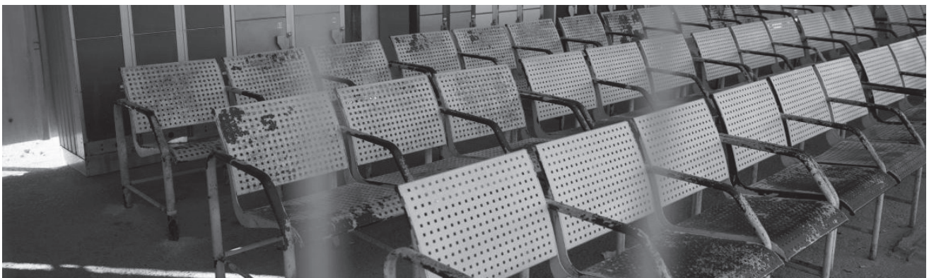
Ofer military court, West Bank - 29 October 2017. A waiting area for Palestinians waiting to enter court hearings on family and friends who were arrested by the Israeli army, Ofer military camp.

Por todo lo mencionado, las medidas legislativas, administrativas e institucionales adoptadas a consecuencia de la pandemia de COVID-19 se han añadido a las políticas discriminatorias y opresivas del régimen de ocupación y de apartheid israelí, anteriores a la pandemia. Estas medidas se han implementado con el fin de poner más obstáculos entre las representantes y las representadas –las personas palestinas detenidas, de dificultar cualquier tipo de representación efectiva posible y de agravar las vulneraciones masivas del derecho a un juicio justo , inherentes al sistema judicial militar israelí.